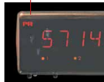
Spritzwassergeschützt für raue Umgebungen.