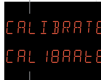
Zum Vergleich der Text in einer 7-Segmentanzeige.